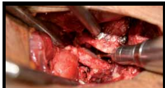
Figura 4: Remoção de osteófitos