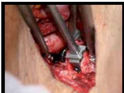
Figura 5: Colocação do implante de prova