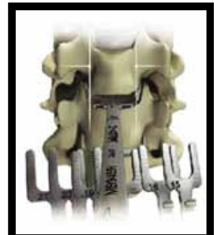
Figura 2: Determinação da largura

Faz-se o teste do pressfit para assegurar a boa estabilidade do implante. Realiza-se a montagem do implante conforme a medida prévia. Introduce-se o implante no espaço discal e verifica-se o correto posicionamento sob fluoroscopia. Libera-se a tração dos pinos de caspar a fim de permitir a compressão e fixação dos dentes do implante no corpo das vértebras (figura 6).