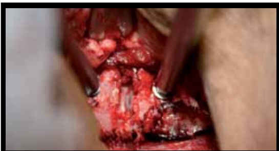
Figura 3: Pino de Caspar